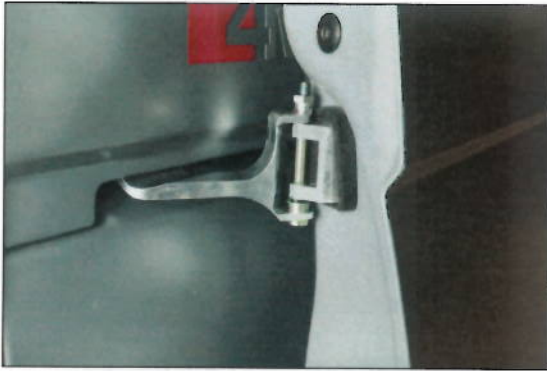
Rechts fertig montiertes Schiebetür Scharnier