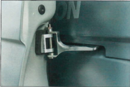
Links fertig montiertes Schiebetür Scharnier